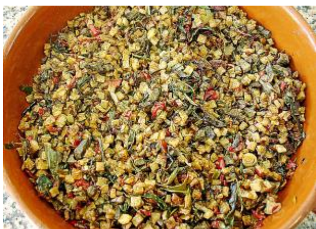
Традиционное блюдо – жаркое из потрохов frit mallorquíu

Майоркинская кухня (Cuina Mallorquina) имеет, в основном, слегка крестьянский акцент. Море, конечно, всегда играло немаловажную роль в кулинарии острова, но сельское хозяйство всё равно главенствовало. Типичные блюда майоркинцев – тяжёлые и сытные, с использованием мяса и тушёных овощей. Их зачастую подают в традиционной глиняной посуде – горшках (olles) и формах для запекания (greixoneras).