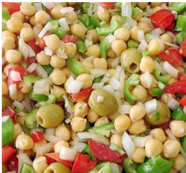
Лёгкий летний салат «трампо» с помидорами и луком

В каждой стране есть свои особенные предпочтения в еде. Обзор типичных майоркинских блюд и ресторанов