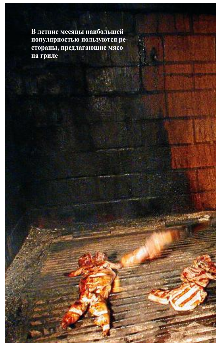
В летние месяцы наибольшей популярностью пользуются рестораны, предлагающие мясо на гриле

Майорки, в деревушке Сес-Салинес (Ses Salines) находится настоящее сокровище для гурманов, предпочитающих рыбные продукты. В семейном ресторанчике Casa Manolo с потолка свисают хамоны, все стены увешаны фотографиями знаменитостей, побывавших здесь, а также членов семьи и друзей владельцев. Даже король испании Фелипе однажды ужинал здесь