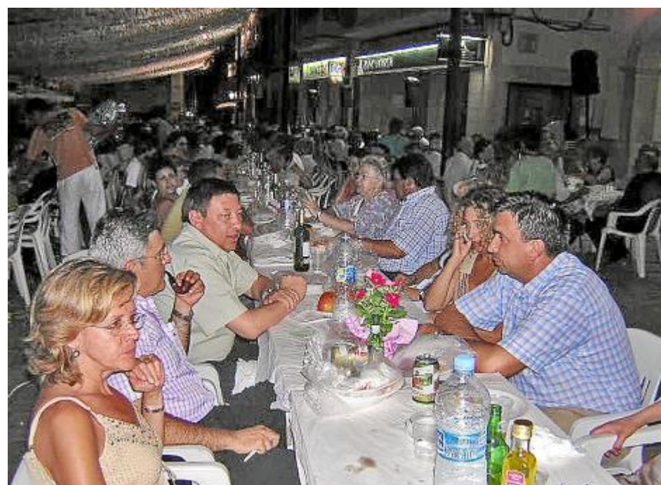
Soper a la fresca – летом в деревнях сооружают длинные столы и ужинают все вместе прямо на улице