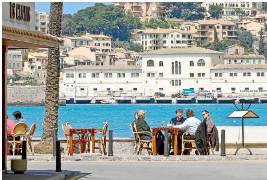
Набережная порта – любимое место отдыха гостей этого очаровательного городка