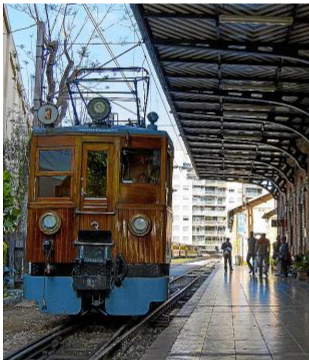
В 1912 году была создана железнодорожная линия, ведущая в Пальму. Эту дорогу называют апельсиновым экспресом

Из-за горного препятствия Пальма долгое время казалась куда более далёкой, чем Франция, куда можно было из Сольера легко попасть на корабле. Так получилось, что местные жители перевозили выращенные собственными руками фрукты на «апельсиновых» пароходах в соседнюю страну. Члены многих семей эмигриро-