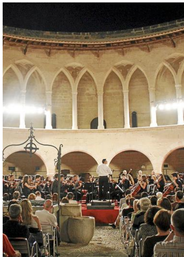
3 меццосопрано выступят перед публикой 29 августа в 21:30 в замке Бельвер (Castell de Bellver) в Пальме. Они представят публике отрывки из знаменитых арий, испанской сарсуэлы и известных мюзиклов. Стоимость билетов в предварительной продаже: 12 евро (билеты в магазине Tot Classic и консерватории Пальмы), или 15 евро в кассах на входе в замок.

Блошинный рынок: Consell (вс 9:00-14:00), Lluçmajor (пт 9:00-13:00), Palma (Son Fusteret, сб 9:00-13:00), Santa Ponça (Polígono Son Bugadelles, сб до обеда).