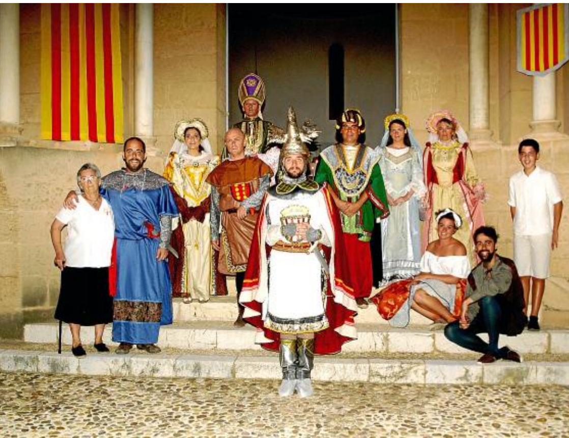
С 8 по 14 сентября в Санта-Понса (Santa Ponça) пройдёт ежегодный праздник, посвящённый высадке каталонских войск на Майорке. 8 и 9 сентября все желающие смогут принять участие в театрализованной экскурсии по местам самых главных сражений Кальвии. Информация и запись по телефону 971-139-181. 9 сентября на площади Pinada в 21:30 и 23:00 пройдут концерты, а 10 сентября на набережной города – пиротехническое шоу correfoc. 12 сентября советуем не пропустить карнавальную парад войск сарацинов – начало в 20:00 на площади Pinada.