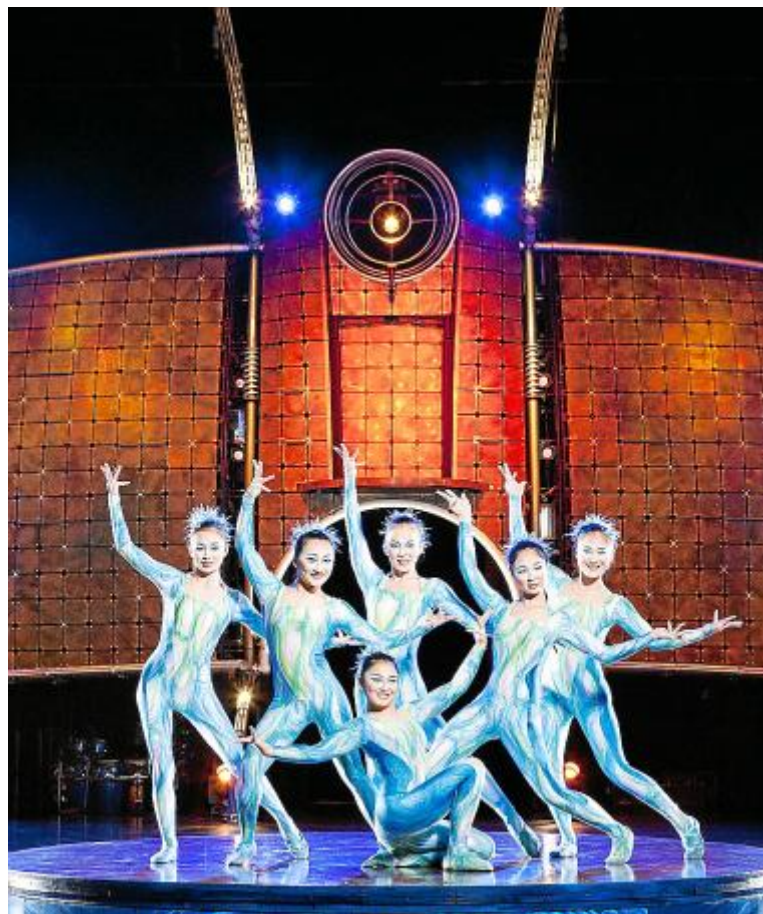
В воскресенье, 31 августа, и в субботу, 6 сентября, в Palma Arena пройдёт выступление знаменитого шоу Cirque du Soleil – Dralion. Начало спектаклей 18:00 и 21:30. Билеты можно приобрести на сайтах: www.ticticket.com , www.entradas.com или в универсаме El Corte Inglés.