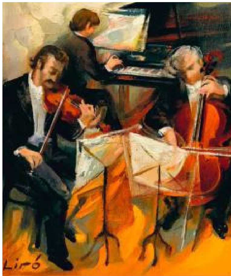
Семейный рождественский концерт Musica y Danza Española состоится 15 декабря в 12:00 в Teatre Principal. В программе – произведения испанских композиторов в исполнении камерного оркестра Луиса Корреа (Luis Correa) и хореографическая постановка. При участии агентства Creative Best Services Mallorca. Билеты – в кассе театра или на сайте www.teatreprincipal.com . Стоимость: 12 и 7 евро (взрослые и дети до 12 лет).

Альтернатива семейному застолью в новогоднюю ночь – встреча праздника под бой часов на площади Cort у мэрии Пальмы. С 23:00 горожан развлекает DJ Samros и др. музыканты.