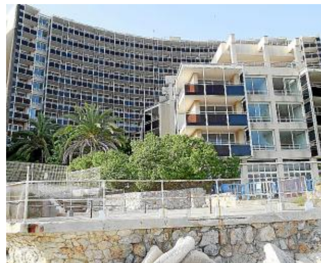
План реконструкции Uto Palace (слева). Так выглядит отель сегодня (вверху). Здание бывшего отеля должно быть снесено.

тир ещё до конца 2013 года. «Общий размер инвестиций составит 50 млн. евро», – прокомментировал генеральный директор «Бендинат» Адольфо де Коэне (Adolfo de Coene) представителям испанской прессы.