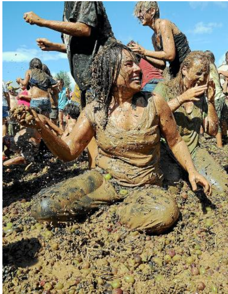
Биниссале (Binissalem) готовится к празднику вина. Кульминация феерии – весёлая битва виноградом, которая состоится 29 сентября в 12:00 (фото верху). 29 сентября в 17:00 интересно будет посмотреть на шествие с празднично украшенными машинами.

В Пальме, 20 сентября, пройдёт ночь искусства, Nit de l'Art. Галереи и музеи будут открыты до полуночи, многие к этому случаю готовят различные выставки и представления. Nit de l'Art стала в последние годы настоящим аттракционом – тысячи посетителей устремляются в город и переходят от галереи к галерее или же наслаждаются искусством уличных художников. Рестораны в это время переполнены.