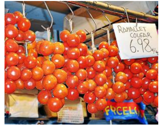
Помидоры вплетают в «косичку» и подвешивают – благодаря такому способу хранения они остаются свежими особенно долго.