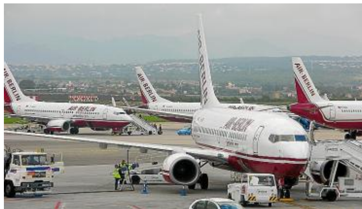
Сон-Сант-Жоан – один из самых оживлённых гражданских аэропортов в мире. Ежегодно через него проходят 22 млн. пассажиров.