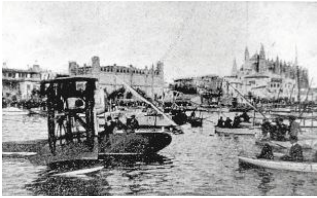
Сенсация: в Пальме впервые приземлился гидросамолёт. На его борту были свежие газеты из Барселоны. 1920 год.