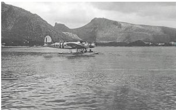
Во время гражданской войны в Испании (1936-1939) бухта Польенсы использовалась как военная база.