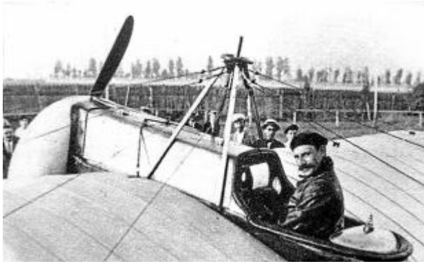
Каталонский пилот Сальвадор Хедилья совершил первый двухчасовой перелёт с материка на остров 2 июля 1916 года.