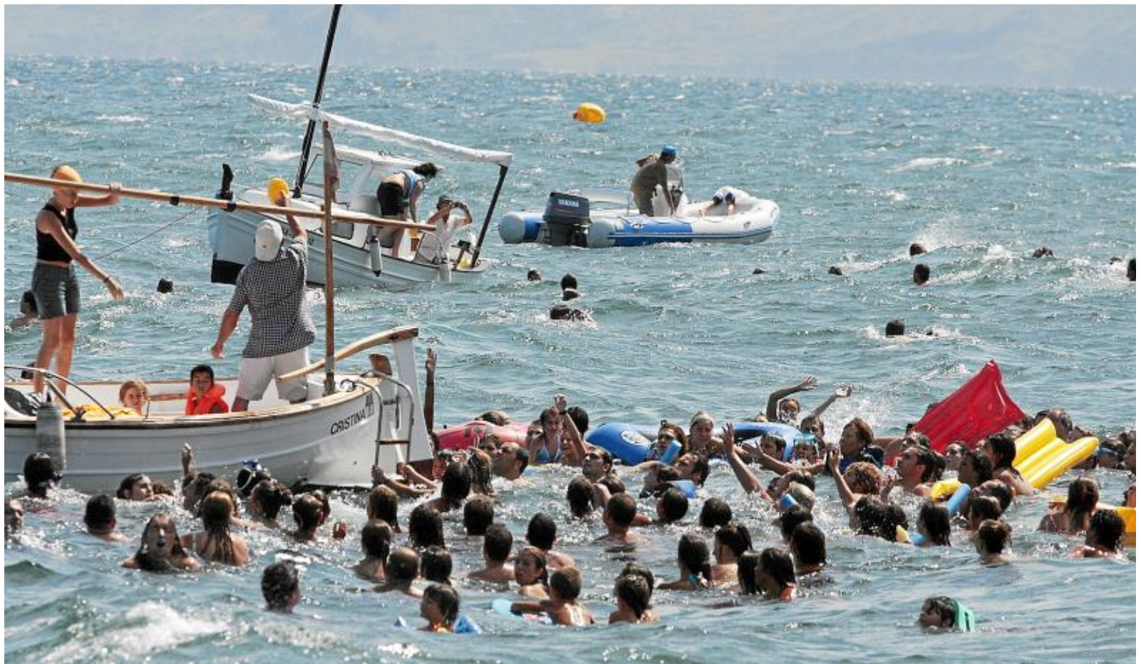
Народный праздник Suelta de Patos в Кан-Пикафор. Теперь можно использовать только пластиковых уток. До 2006 года это были живые птицы.

«Бросание уток» проходило приблизительно так: с лодок, находившихся недалеко от берега, бросали в воду живых уток, а плавающие рядом молодые люди ловили их. Часто с утками обходились довольно грубо, и многие птицы в азарте такой «охоты» получали ранения или да-