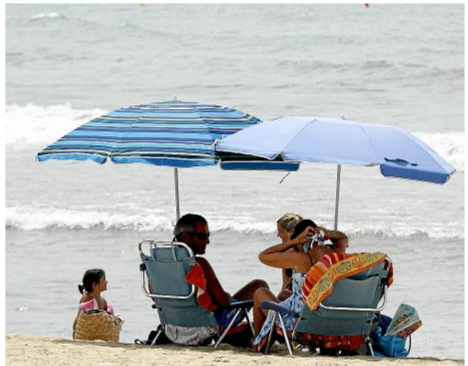
Жители Майорки стараются проводить самые жаркие летние дни на берегу моря.