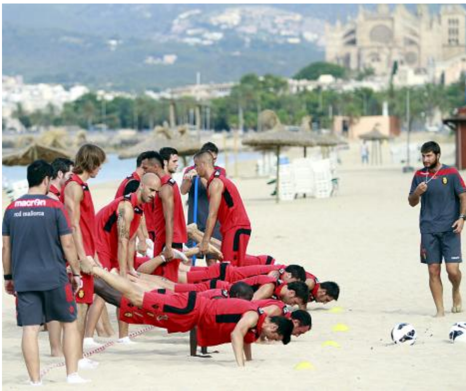
Команда получила новые спортивные костюмы – теперь и шорты красного цвета. В середине июля футболисты отправляются на тренировки в Голландию.