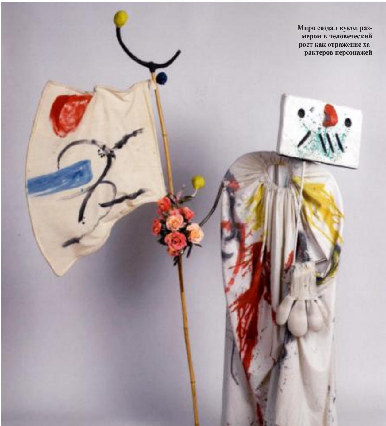
Миро создал кукол размером в человеческий рост как отражение характеров персонажей