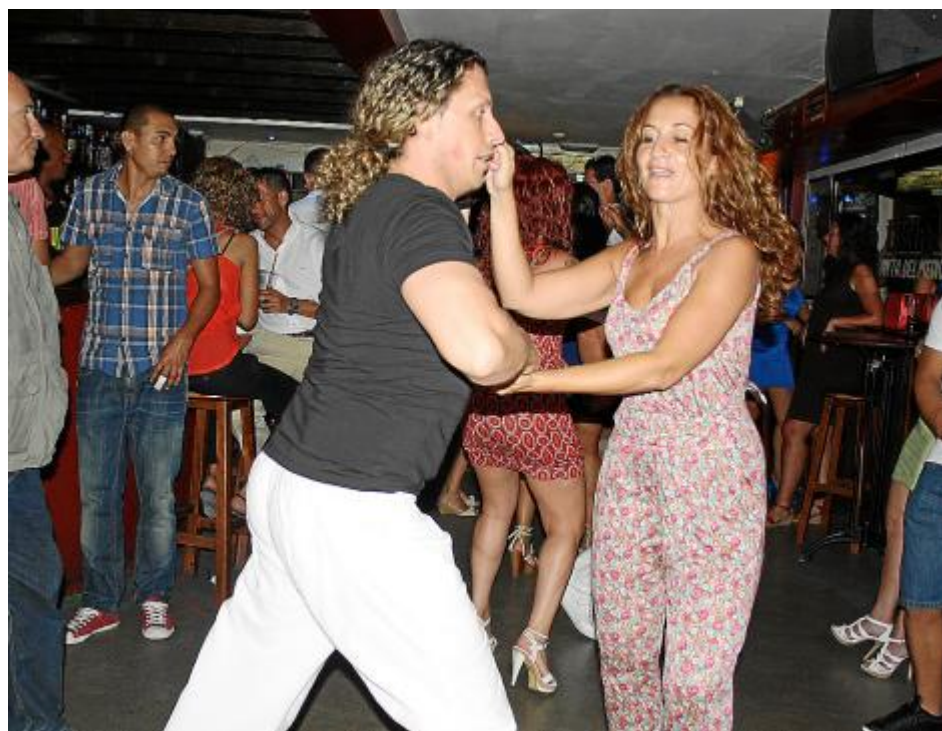
Латиноамериканские ритмы всегда очень популярны. В баре La Bodeguita del Medio танцуют сальсу, меренгу и кумбию.

А в соседней таверне Shamrock играли ди-джеи. Девиз заведения с логотипом в виде зелёного три-