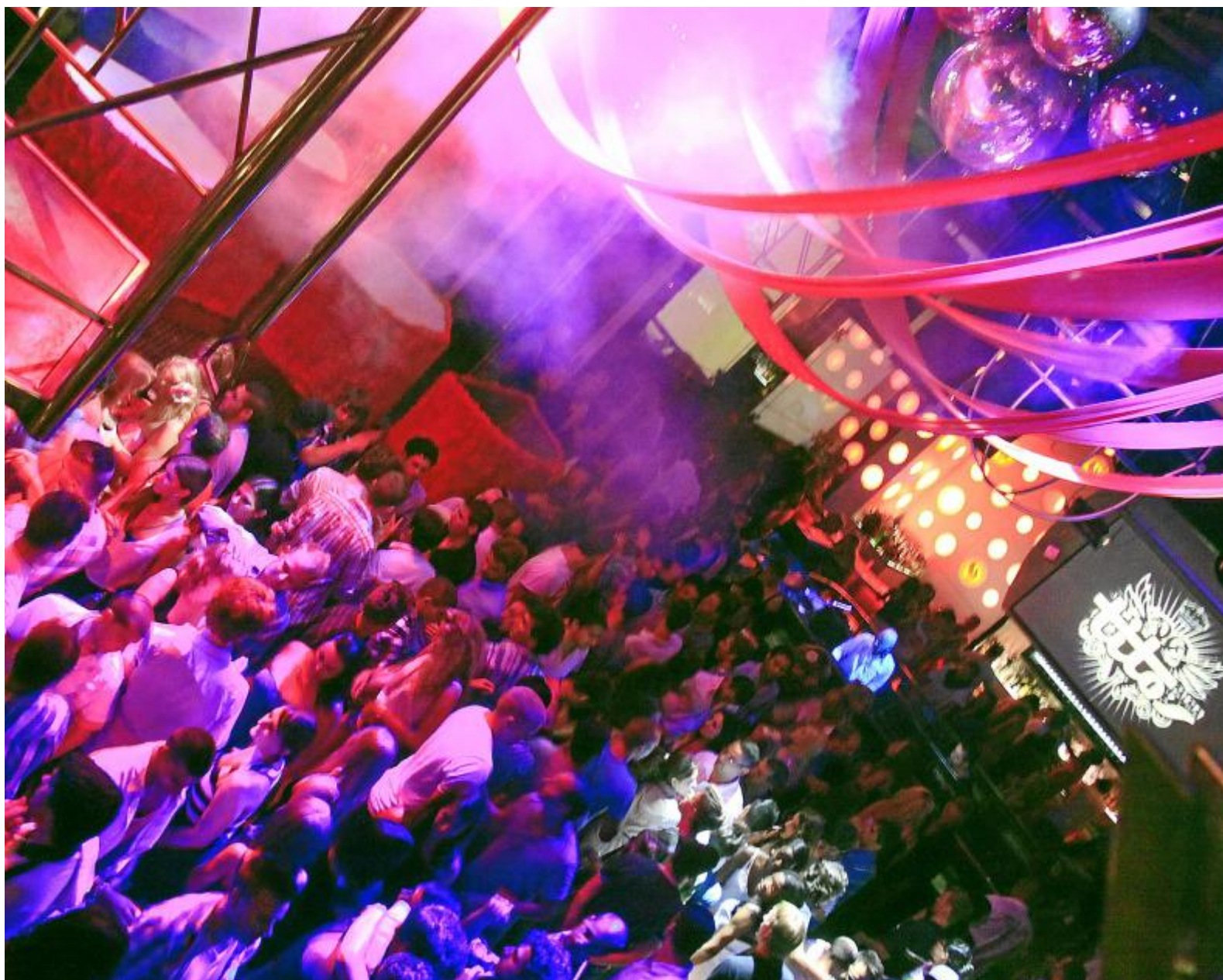
На самых крупных танцполах Пасео Маритимо многолюдно даже среди недели.

На главной набережной Пальмы найдутся развлечения на любой вкус